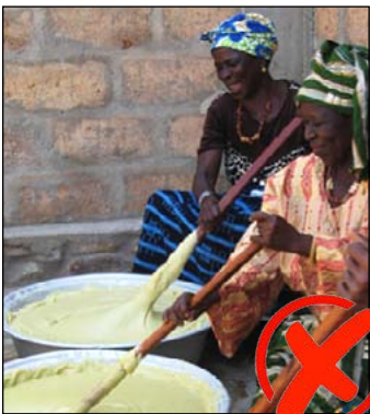
Afrikaanse vrouwen bereiden Sheaboter. Bron: Internet