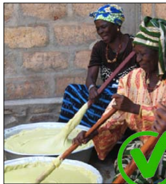
Vrouwen van het Alaffia Shea Butter Cooperative, in Togo, West-Afrika, bereiden Sheaboter.